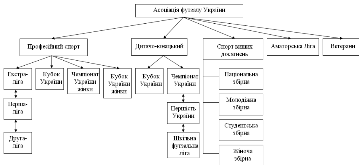
Рис. 2. Система змагань з футболу, що проводяться під егідою АФУ

Важливим моментом в розвитку виду спорту є система змагань. Асоціація футболу України проводить змагання з усіх основних напрямків розвитку спорт: професійного – чемпіонат, першість, Кубок України та Суперкубок України серед команд професійних клубів; чемпіонат, першість і Кубок України серед жіночих команд; спорту вищих досягнень – збірні команди України (Національна, молодіжна, студентська, жіноча) дотримуючись міжнародного календаря матчів, складеного ФІФА/УЄФА; та масового спорту – чемпіонат та Кубок України серед аматорських команд; чемпіонати та першості серед аматорів фізкультурно-спортивних товариств та відомств; чемпіонат і першість України серед дитячо-юнацьких команд у різних вікових категоріях; чемпіонат та Кубок України серед студентських команд (рис.2).